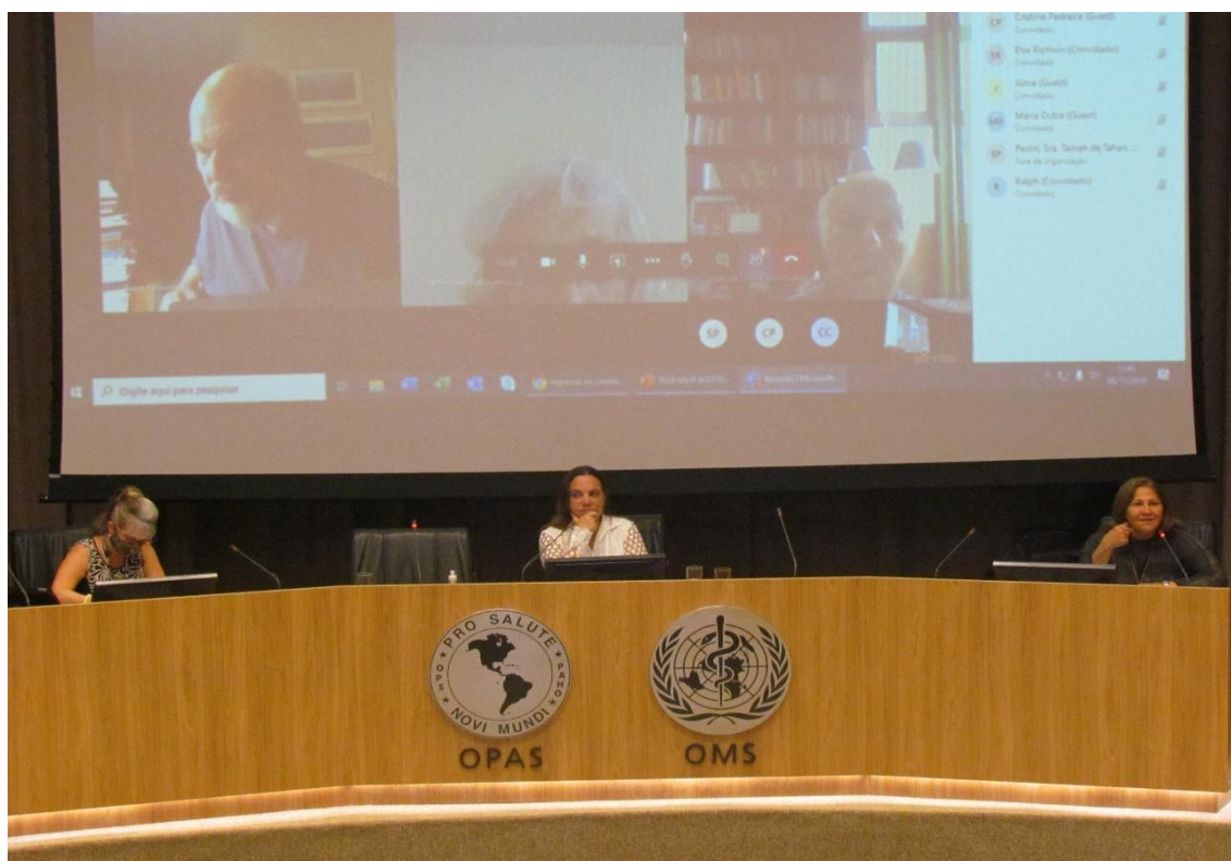
Reunião da AAFIB na sede da OPAS/OMS, em Brasília

Sede da AAFIB: Av. Marechal Floriano, 196 - Palácio Itamaraty: UNIC-Rio / Centro / Rio de Janeiro / RJ / CEP: 20080-002. Visite o website da AAFIB - www.aafib.net